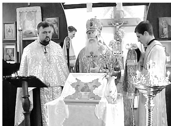
Освящение храма 1 февраля 2004 года

- нет крестов и куполов. Однако на сегодняшний день уже три церкви строятся, и четвертая (надеюсь не последняя) - планиру-